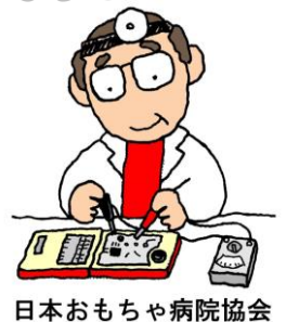
日本おもちゃ病院協会

☆活動内容 壊れたおもちゃを修理します。（一度に3つまで） ※ただし、当サークルはおもちゃ修理のプロではありません ので直らないおもちゃもあります。ご了承下さい。 ※ボランティアの協力による活動ですので、ある程度の 修理期間をいただく場合があります。